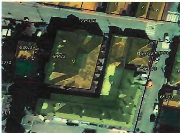
Слика 1 - Приказ к.п.бр. 644/2 КО Чачак

У прилогу је налаз и мишљење вештака на околност података о посебном делу зграде, од 28.07.2023. године, а све у складу са унапред наведеним у пасусу изнад.