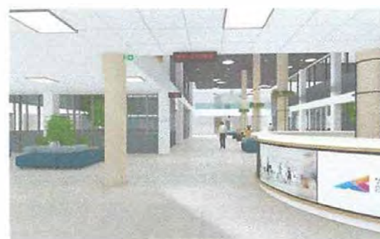
Слика 6 - Графички приказ ентеријера

На свакој етажи заједничке, пратеће просторије су типски распоређене око вертикалних језгара (путнички и теретни лифтови са степеништима) и оне једине имају фиксне позиције: