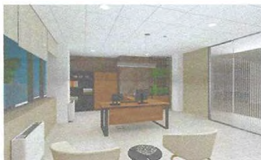
Слика 2 - Графички приказ ентеријера