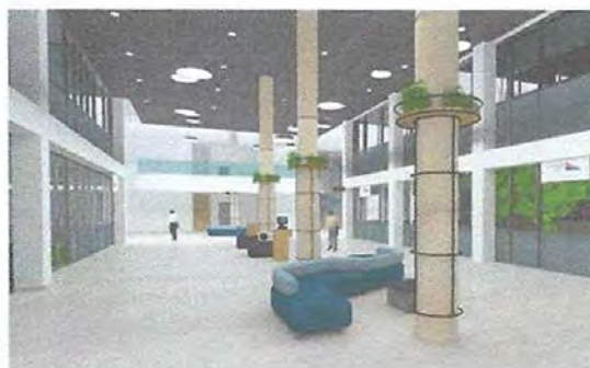
Слика 5 - Графички приказ ентеријера