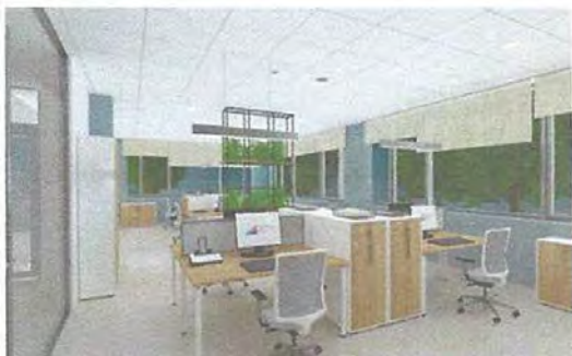
Слика 1 - Графички приказ ентеријера