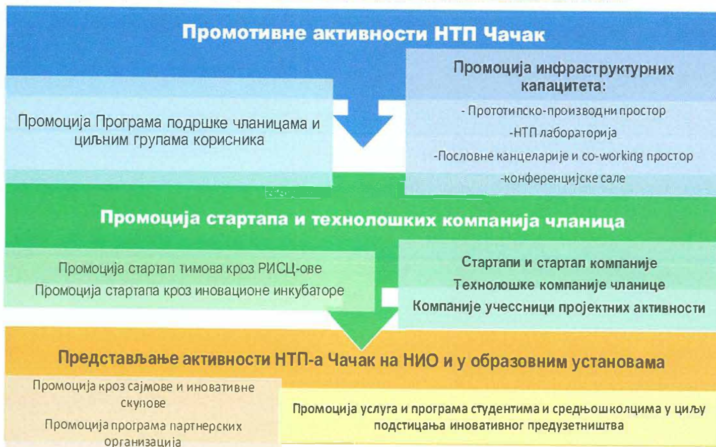
Графички приказ 2: Промотивне активности усмерене ка дефинисаним циљним групама