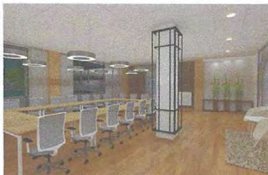
Слика 3 - Графички приказ ентеријера