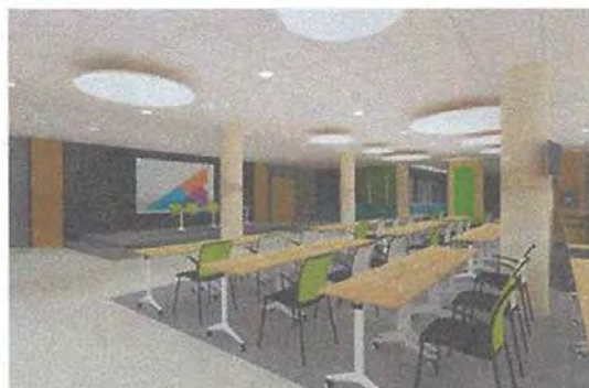
Слика 4 - Графички приказ ентеријера