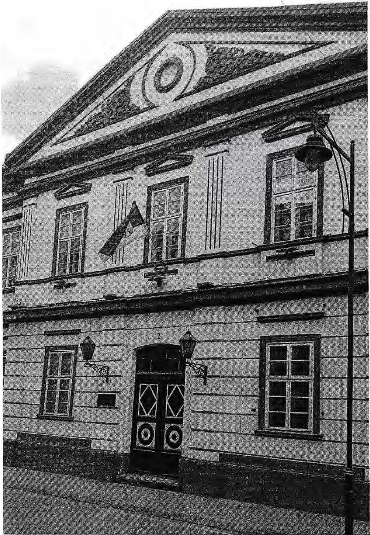
Зграда Начелства , главни улаз у Међуопштински историјски архив